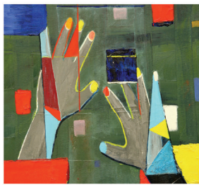
LE PRESBYTÈRE DE BLUE SEA