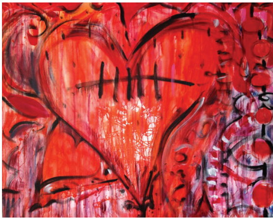
Artiste : Sylvie Grégoire Titre : Célébration